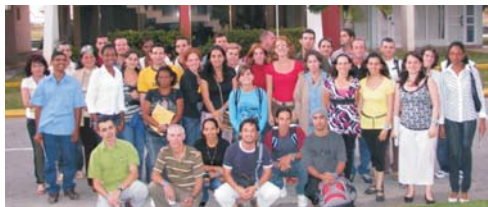
Fig. 1. Participantes en el Taller "GBIF Cuba 2010".

Para más información: gbifcuba@yahoo.com