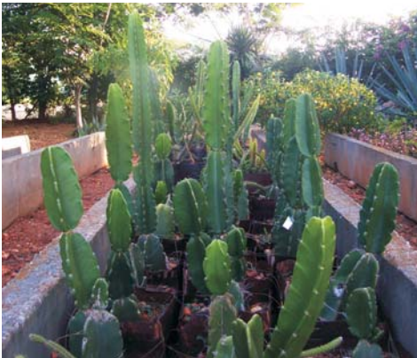
Fig. 1. Colección ex situ de Dendrocereus nudiflorus en el Jardín Botánico de Matanzas.

Sin embargo, las poblaciones de Coccothrinax borhidiana y D. nudiflorus en Punta Guanós (con 563 [4] y 47 [5] individuos respectivamente) están seriamente afectadas por la fragmentación del hábitat, la tala, el fuego, la construcción de viales y la ubicación de instalaciones para la explotación petrolera [4].