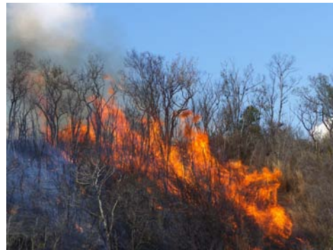
Fig.1. Incendio de "Lomas de La Coca" en La Habana, el 27 de abril de 2011. El fuego devastó la rara variante mesófila del matorral xeromorfo espinoso sobre serpentinita y la variante típica casi en su totalidad.

madas aislándolas de aquellas ya afectadas por el fuego [8] y controlar la biomasa del estrato herbáceo en las áreas quemadas.