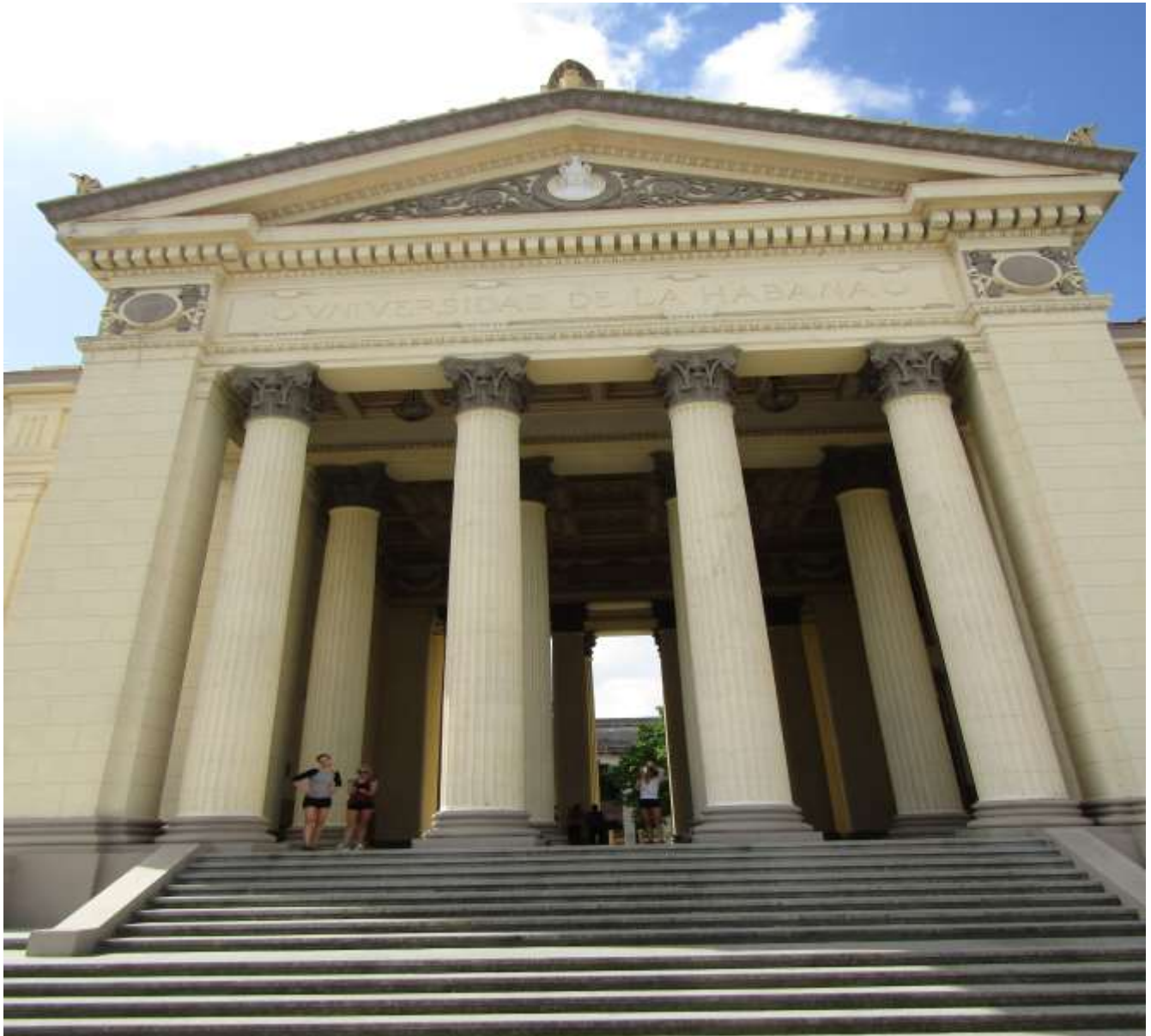
Edificio del Rectorado