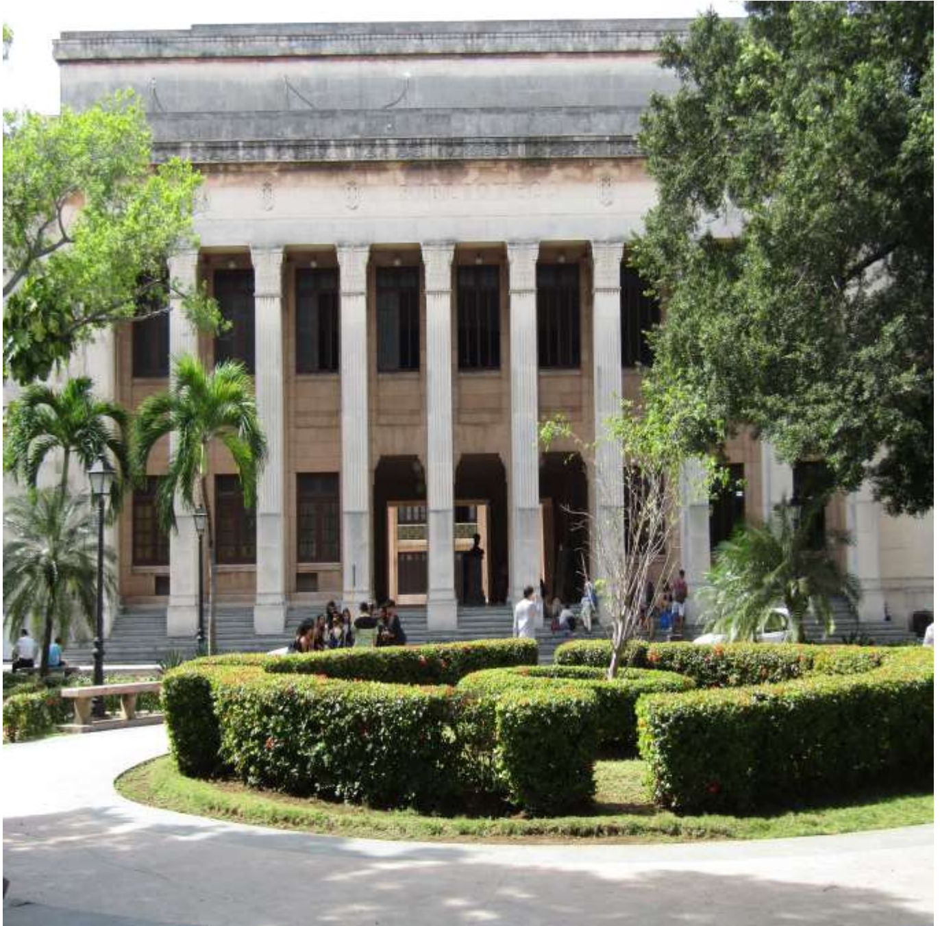
Biblioteca Rubén Martínez Villena