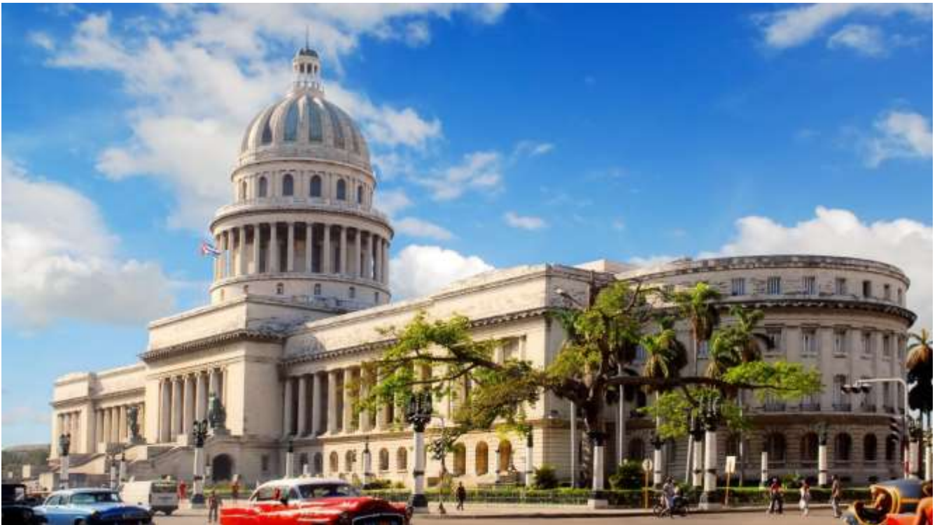
Imagen del Capitolio, sede de la Asamblea Nacional del Poder Popular

La Habana es la capital de la República de Cuba, principal puerto y centro económico-cultural. Es la sede oficial de los órganos superiores legislativo, ejecutivo y judicial del