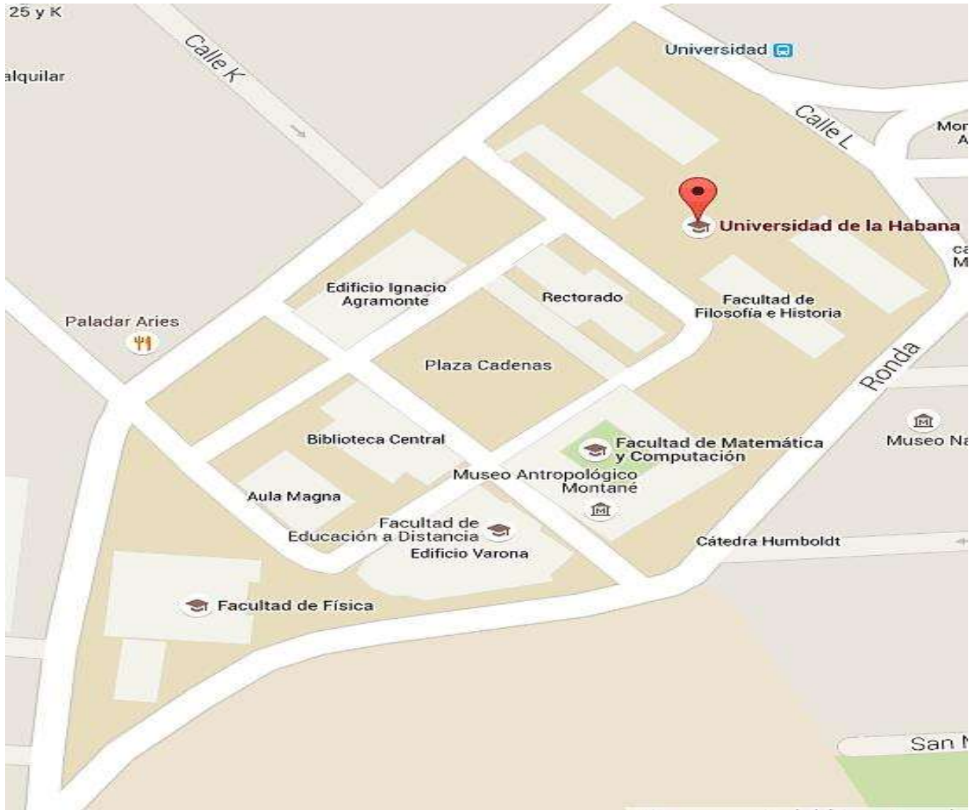
Plano del Campus Central