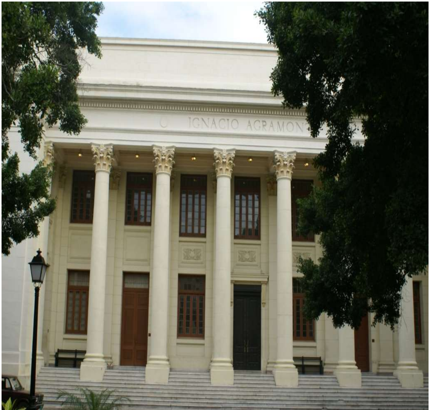
Facultad de Derecho