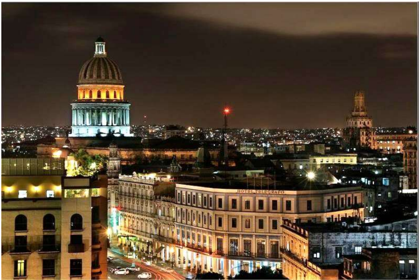
Imágenes de La Habana Vieja de noche

Estado, de todos los organismos centrales y de casi la totalidad de empresas y asociaciones de ámbito nacional. Es también conocida por el nombre fundacional de Villa de San Cristóbal de La Habana. Fue fundada el 16 de noviembre de 1519 por el conquistador español Diego Velázquez de Cuéllar. Su casco histórico fue declarado Patrimonio de la Humanidad por la UNESCO en 1987.