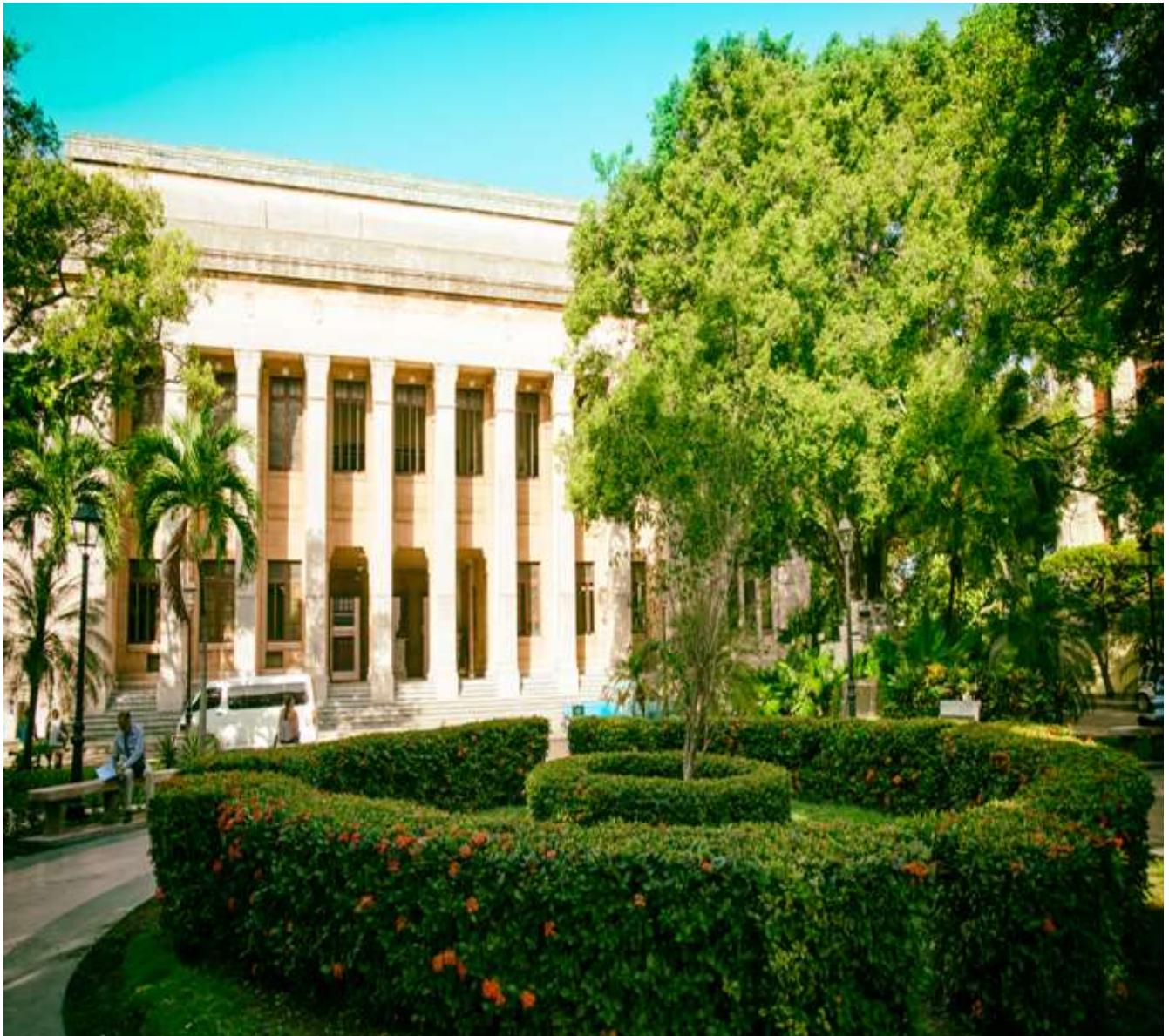
Campus Central Universitario